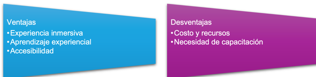
Fig. 2: Ventajas y desventajas de la RA y la RV

Son tecnologías mediante las cuales es posible crear entornos con alto nivel de interacción, gracias a que se le dice la combinación de elementos virtuales con elementos presentes en entornos físicos, lo que hace posible mejorar la comprensión sobre conceptos con alto nivel de abstracción y posibilitando la experiencia educativa inmersiva (Freire, 2024). A continuación, se presentan las principales ventajas y desventajas: