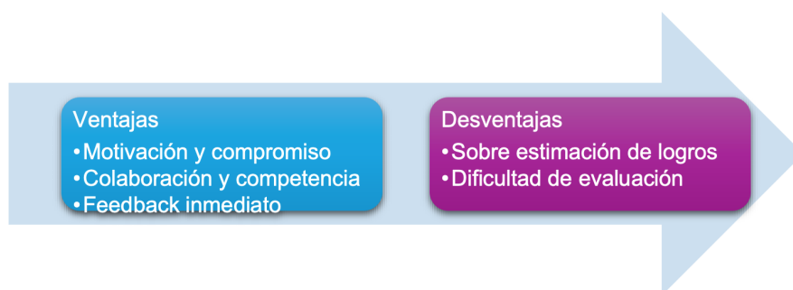
Fig. 3: Ventajas y desventajas de la gamificación

A continuación, se presentan las principales ventajas y desventajas de la gamificación: